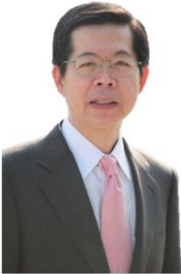
ประสาร ไตรรัตน์วรกุล ผู้ว่าการธนาคารแห่งประเทศไทย